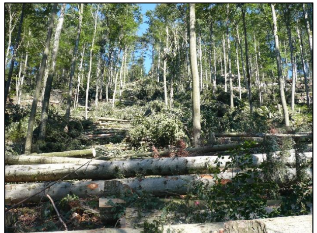
Flacher Hang mit teilweiser Blocküberlagerung und unvollständiger Rückegassen-Erschließung.