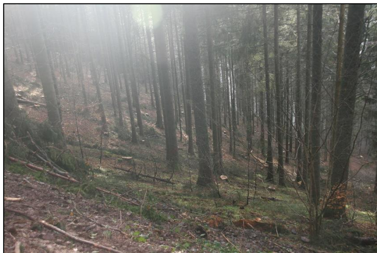
Mittelsteiler Hang mit zahlreichen Quellhorizonten, zuvor mit Rückegassen erschlossen.