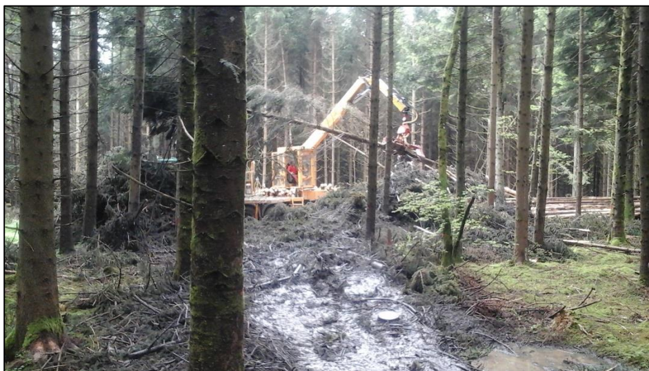
Einsatz des Gebirgsharvesters im Sturmholz auf einer extremen Nassfläche im Jahr 2015. Die Vorkonzentration erfolgte mit der Kleinraupe. Das Holz konnte vor dem Käferflug aufgearbeitet werden.

Zur weiteren Stabilisierung der Kosten hat auch der 2014 beschaffte Endmastbagger mit Monoblockstieltrennung beigetragen.