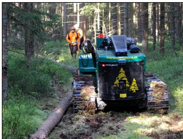
Nasser Standort (ForstBW-Betriebsteil Schwarzwald-Baar-Kreis) mit vorhandener Rückegassen-Erschließung.