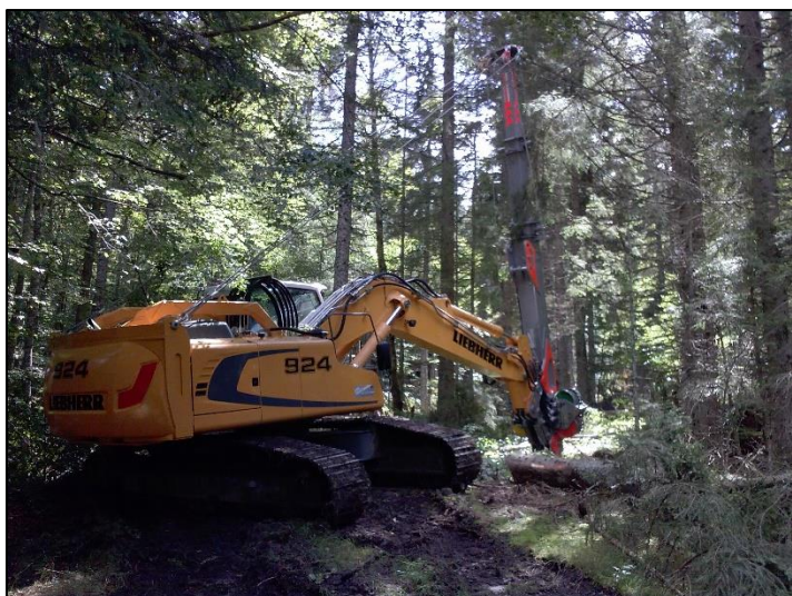
Einsatz des Endmastbaggers als Endbaustütze.